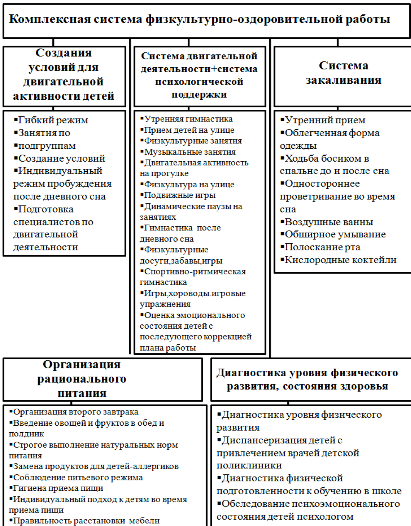
Схема 5. Комплексная система физкультурно-оздоровительной работы.

закаливающие мероприятия, которые осуществляются в пределах времени, необходимого для осуществления функций присмотра и ухода за детьми.