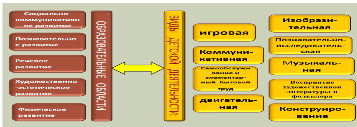
Схема 1. Формы работы с детьми

Содержание воспитательно-образовательного процесса соответствует основным положениям возрастной психологии и дошкольной педагогики и выстроено по принципу развивающего образования, целью которого является развитие ребёнка, обеспечивает единство воспитательных, развивающих и обучающих целей и задач.