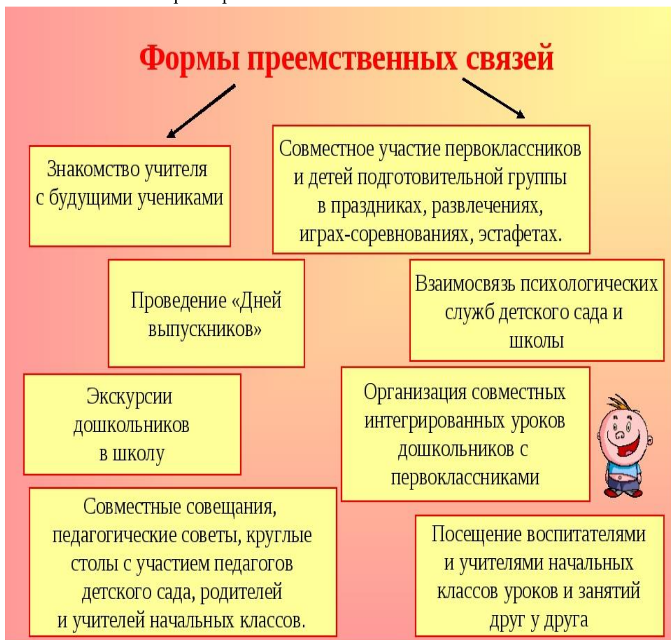
Схема 11. Формы преемственности связей

В целях реализации преемственности детского сада и школы в разработан план мероприятий по развитию преемственности (схема 11). Он предусматривает взаимодействия педагогов детского сада и начальной школы по адаптации детей к условиям школьного обучения. Заключается договор о совместной работе школы с детским садом. С целью определения уровня готовности детей к обучению в школе проводится диагностика, по итогам которой определяется уровень индивидуального развития ребенка. При выпуске дошкольника заполняется нормативная карта индивидуального развития ребёнка-выпускника детского сада, которая передаётся в школу (договор, план работы со школой, нормативная карта дошкольника прилагается).